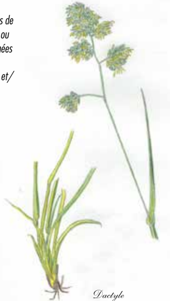
Dactyle Dactylis glomerata Poacées

Ces animaux de race pure sont élevés à la pâture sur des parcours composés de prairies naturelles ou semées de graminées (fétuque, dactyle, ray-grass, brome) et/