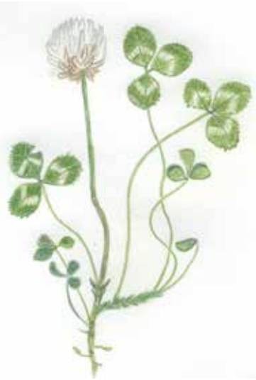
Trèfle blanc Trifolium repens Fabacées

ou de légumineuses (trèfle blanc, violet, incarnat, minette, luzerne) ; ainsi que selon les saisons, des fruits (glands, châtaignes, pommes, nèfles,...) et autres