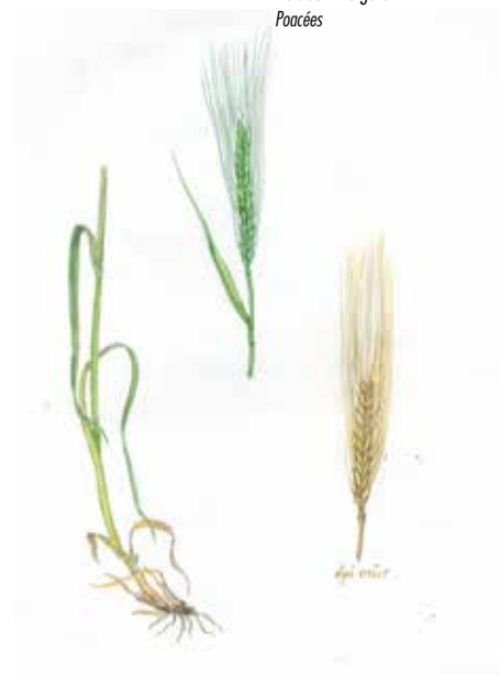
Orge commune Hordeum vulgare Poacées