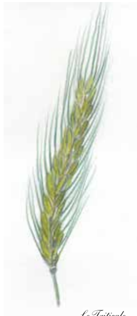
Le Triticale Triticosecale Wittm