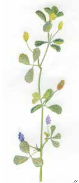
Minette Medicago lupulina Fabacées