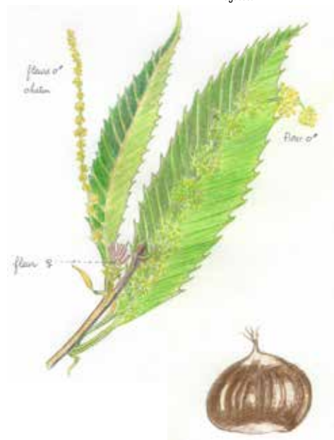
Le Châtaignier Castanea sativa Fagacées