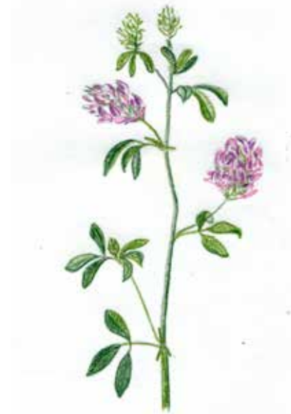
Luzerne cultivée Medicago sativa