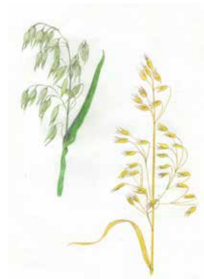
Avoine cultivée Avena sativa Poacées