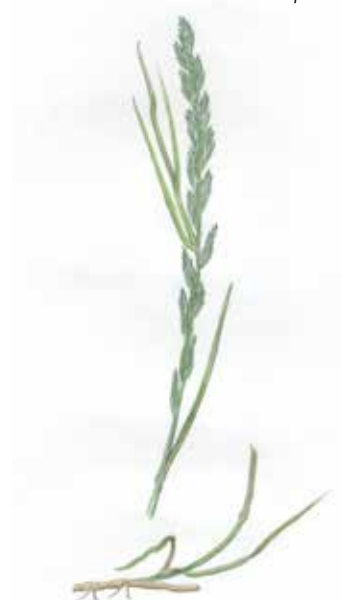
Ray Grass Lolium perenne