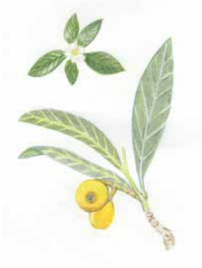
Le Néflier du Japon Eriobotrya japonica Rosacées