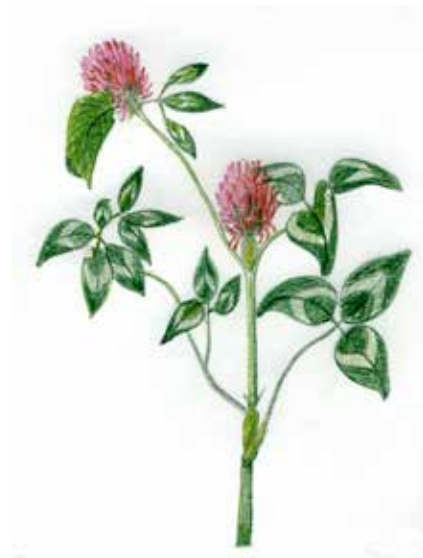
Trèfle commun Trifolium pratense