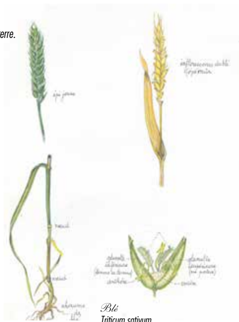
Blé Triticum sativum Poacées

ressources du milieu, de nombreux vers de terre et autres mollusques qu'ils fouillent dans la terre.