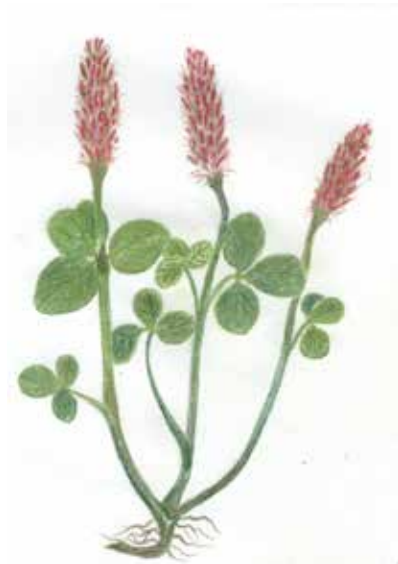
Trèfle Incarnat Trifolium incarnatum