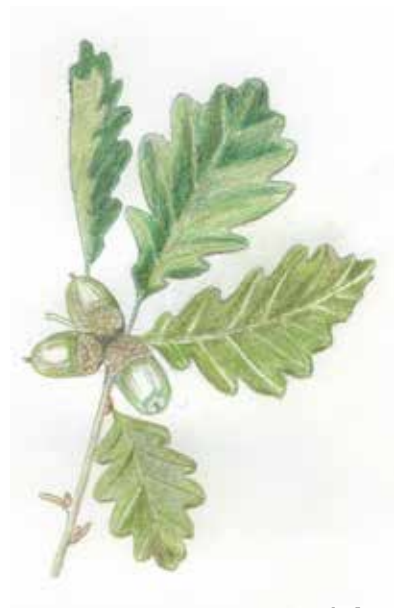
Le Chêne sessile Quercus sessiliflora Fagacées