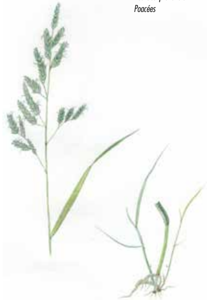
Fétuque des prés Festuca pratensis Poacées